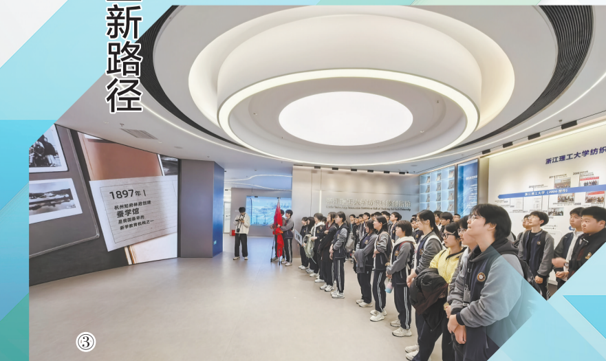
③高中师生参观纺织科技馆新馆。（以上均为学校供图）