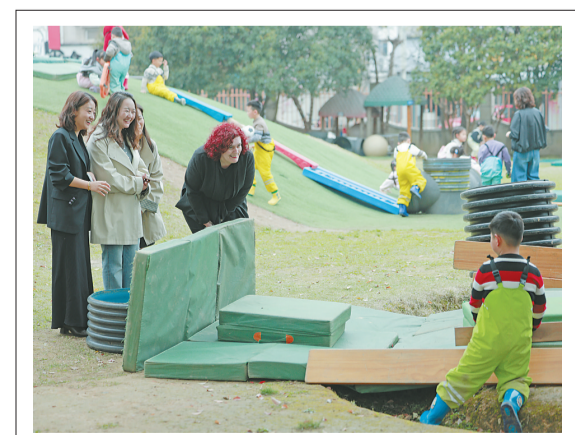
3月26日,世界学前教育组织(O MEP)主席阿德里亚娜·维什尼奇-耶夫蒂奇(A drijana Višnjić-Jevtić)访问安吉,深入安吉县机关幼儿园和安吉县灵峰中心幼儿园大竹园教学点,调研“安吉游戏”。图为O MEP主席一行实地参观安吉县机关幼儿园,观摩幼儿户外自主游戏。