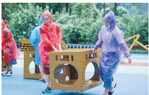
今年第11号台风“轩岚诺”给浙江多地带来大风暴雨。为筑牢抗台防线,我省多地教育系统积极行动,有序做好抗台工作。图为舟山市普陀区龙山幼儿园的老师们正在紧急转移户外器械。

新学期开启,“浙里问学”在线答疑服务也进行了全新升级。按照设区市及县(市、区)顺次,将由轮值县(市、区)教育局组建学科名师团队,以“名师导学+名师答疑”的形式,在每周六继续提供名师答疑服务。同时,“浙里问学”还将面向全省招募常态化在线答疑志愿者教师,提供个别答疑服务。学生可在全时段自由提问,志愿者教师自主选择学生问题予以解答。除此之外,覆盖小学三至六年级和初中全学科的作业指导微课也已全部上线,既可供学生在课后时间通过自主搜索选择相关内容答疑解惑,也可供家长、教师作业辅导参考。