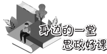
身边的一堂思政好课