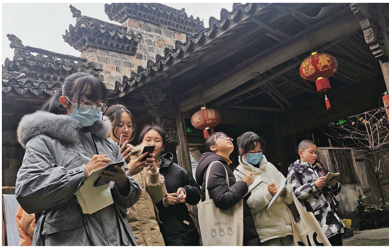
学生在研学活动中认真听讲。