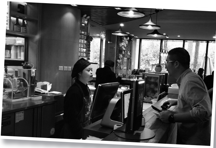
学生在“智慧树”咖啡馆接待顾客。