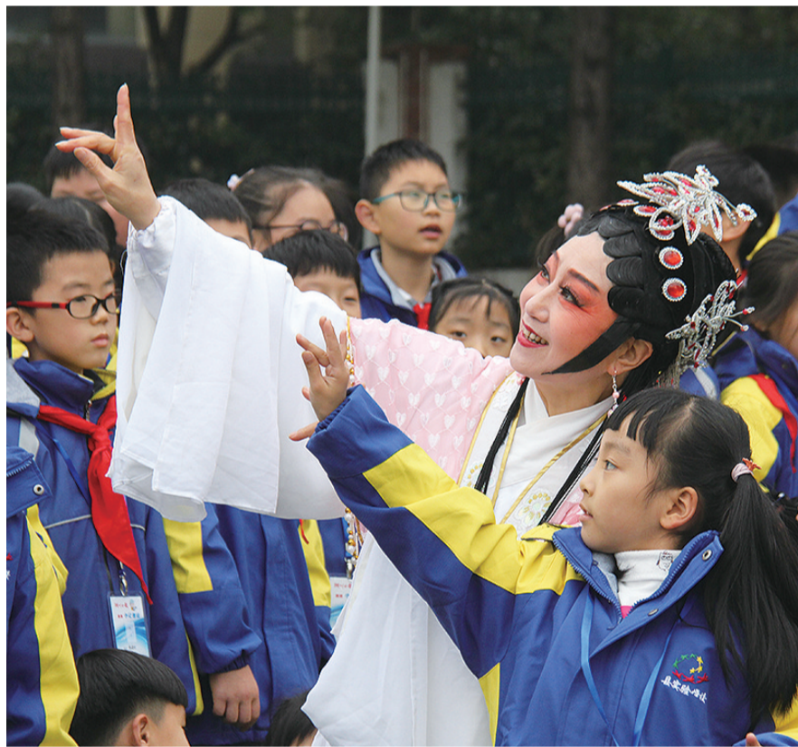
近日,德清县实验学校邀请莫干山越剧团来校开展“传统戏曲进校园”活动。演员们除了表演,还手把手教学生们唱越剧,让学生们零距离感受越剧的魅力。近年来,该校通过开设戏曲课和戏曲社团,组织优秀戏曲演出,让戏曲融入学生生活。图为活动现场。