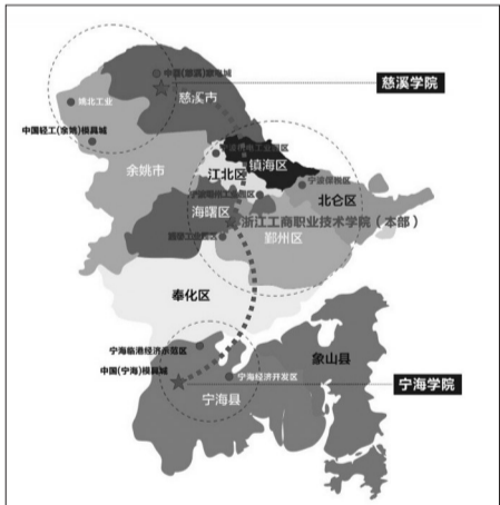
浙江工商职业技术学院先后与宁波、慈溪、海曙等县(市、区)开展校地合作,形成了一体两翼的办学格局。