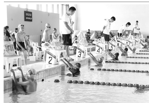
近日,瑞安市举行首次中小生游泳比赛,全市共有93支代表队的614名运动员参加角逐。比赛项目有50米(高中100米)自由泳、蛙泳、仰泳,4×50米自由泳男女混合接力等。图为比赛现场。

全省各级党组织要把开展向陈立群同志学习与庆祝中华人民共和国成立70周年群众性主题教育结合起来,与当前正在开展的“不忘初心、牢记使命”主题教育结合起来,与培育和践行社会主义核心价值观结合起来,运用多种方式宣传陈立群同志的先进事迹。广大党员干部要主动学、深入学、用心学,切实增强干事创业、奋斗担当的责任感、使命感,履行好党和人民赋予的新时代职责使命,为推进“八八战略”再深化、改革开放再出发,高水平谱写新时代中国特色社会主义浙江篇章而不懈奋斗。(2019年9月26日)