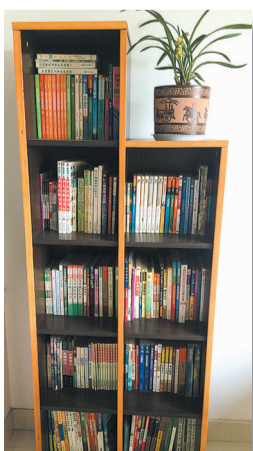
建成时间:2009年 书房面积:12平方米 藏书数量:800本