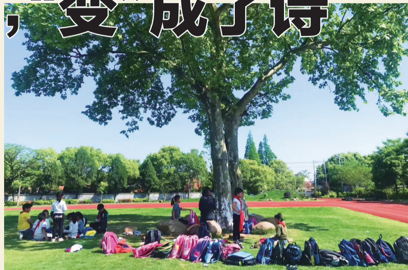
守望树下,是美好的课堂,更是玩耍的乐园。