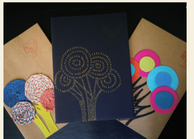
作业本自己设计,铅笔盒、笔筒自己装饰……

所有的学生、教师、家长说“早上好!”有人羞红了脸,有人被吓了一跳……但渐渐地,更多的是欢喜、回应,甚至主动问好。