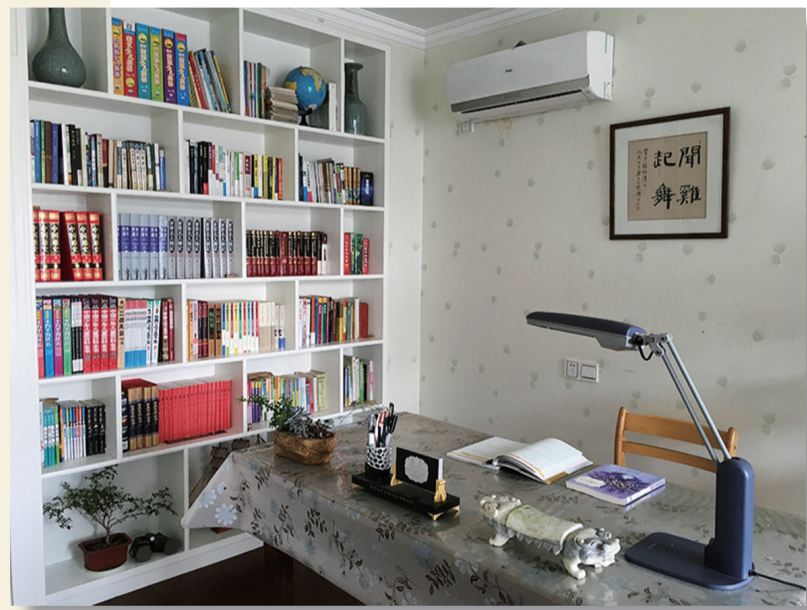
建成时间:2012年1月 书房面积:15平方米 藏书数量:270册