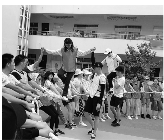
8月25日,桐乡市实验幼儿园开展了教师团队拓展训练活动,近10个趣味游戏传递了“互帮互助凝聚”的团队观念。图为“空中飞人”集体游戏现场。

该园就“新生家访工作”开展研讨,提高教师家访的技巧。同时,根据新生年龄特点制订家访调查表,内容涉及幼儿的生活习惯、兴趣、爱好、在家情况,以及家长对教师和幼儿园的建议。教师们带着事先准备的小礼物入户交流,他们与孩子一起玩游戏,在消除其紧张情绪之余了解孩子,并对家长提出的疑问进行解答。家访后,教师们整理家访信息,建立幼儿家访档案,以便在今后的幼儿园生活中根据孩子的个性差异进行针对性指导,确保家访活动的实效性和连续性。