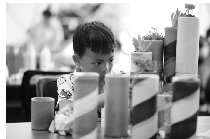
日前,嘉兴市第五届“巧手变宝”创意制作比赛举行,来自南湖、秀洲两区16所绿色学校的近70名学生参加比赛。选手们充分发挥自己的想象力和创造力,利用日常生活中常见的废旧材料,当场设计制作一件件美观、实用的作品。图为比赛现场。

据了解,去年莲都区开展各类农村技术培训班近500期,参加培训人次达到8.92万。培训内容涉及成人高中双证制、保育员、育婴师、中华养生烹饪师、家政服务、家庭教育等28个类别。莲都区教育局成教中心主任潘正亮说,该区各成技校重视品牌,“下一步我们将继续开展好区域特色与品牌项目培训,推进成技校‘一校一品’建设,保证每一所成技校都有自己的培训特色。”