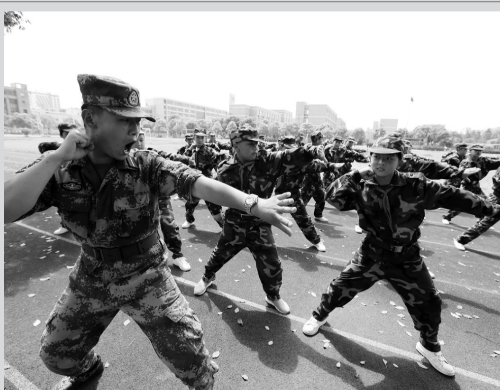
近日,教育部“国防教育特色学校”——桐乡市濮院小学教育集团翔云小学385名五年级学生结束了为期一周的全封闭式军训。在这所农村少年军校,学生们不仅学习了基本的军事知识,更学到了解放军的优秀品质。图为军训现场。